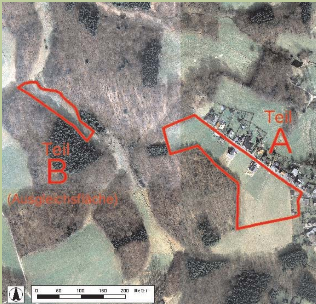
Luftbild © Städtischer Abwasserbetrieb Wermelskirchen (SAW), 2004

Bei dem Bebauungsplan Nr. DH 4 handelt es sich um einen Textbebauungsplan. Entsprechend existiert keine Planzeichnung mit Festsetzungen.