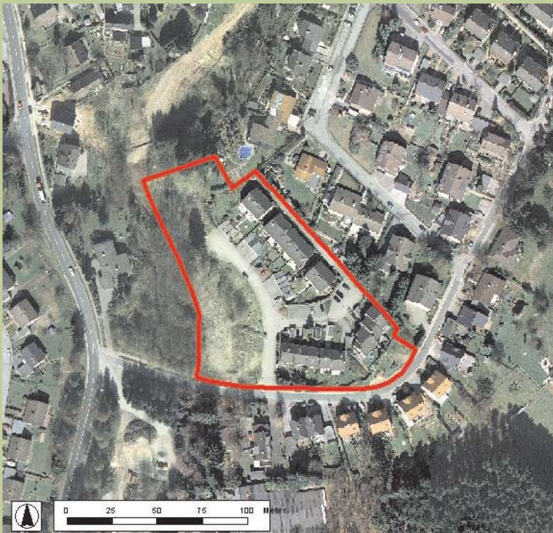
Luftbild © Städtischer Abwasserbetrieb Wermelskirchen (SAW), 2004