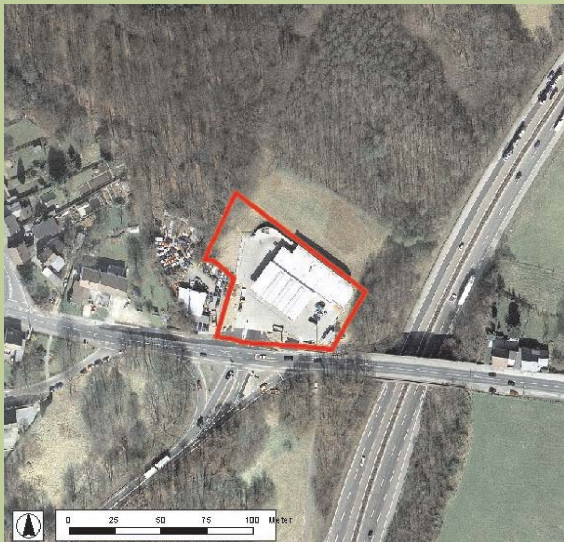
Luftbild © Städtischer Abwasserbetrieb Wermelskirchen (SAW), 2004