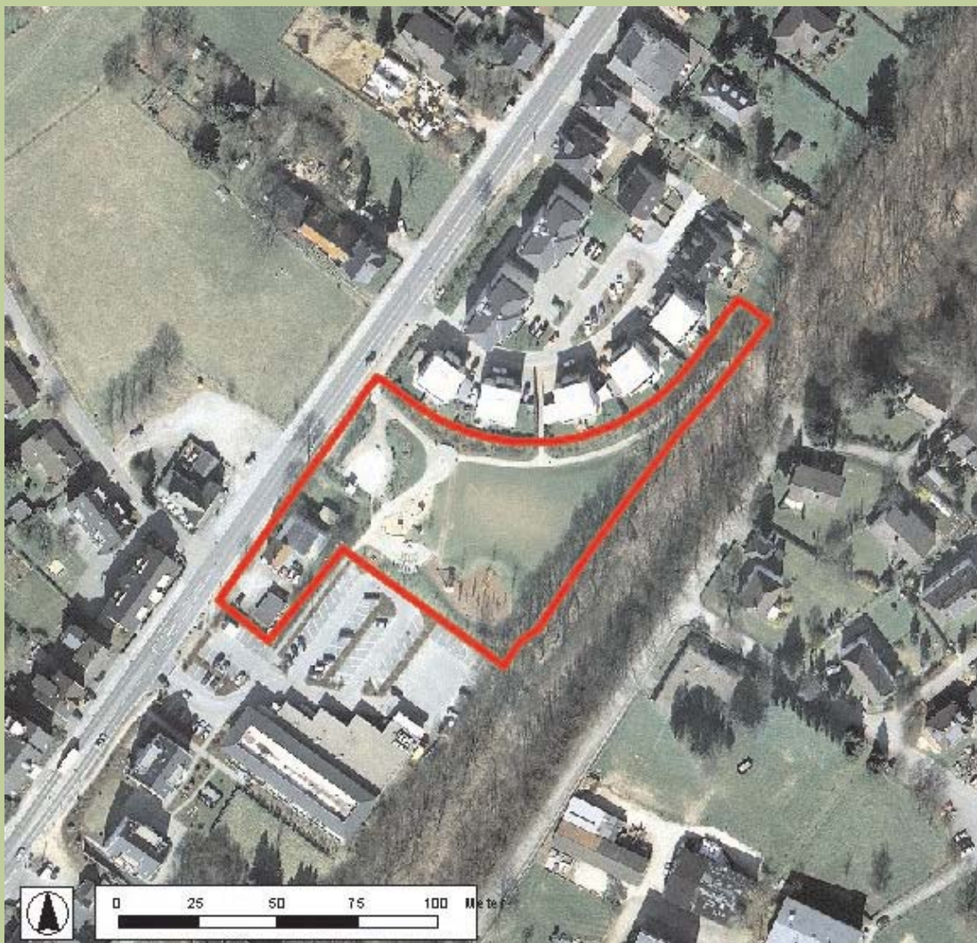
Luftbild © Städtischer Abwasserbetrieb Wermelskirchen (SAW), 2004