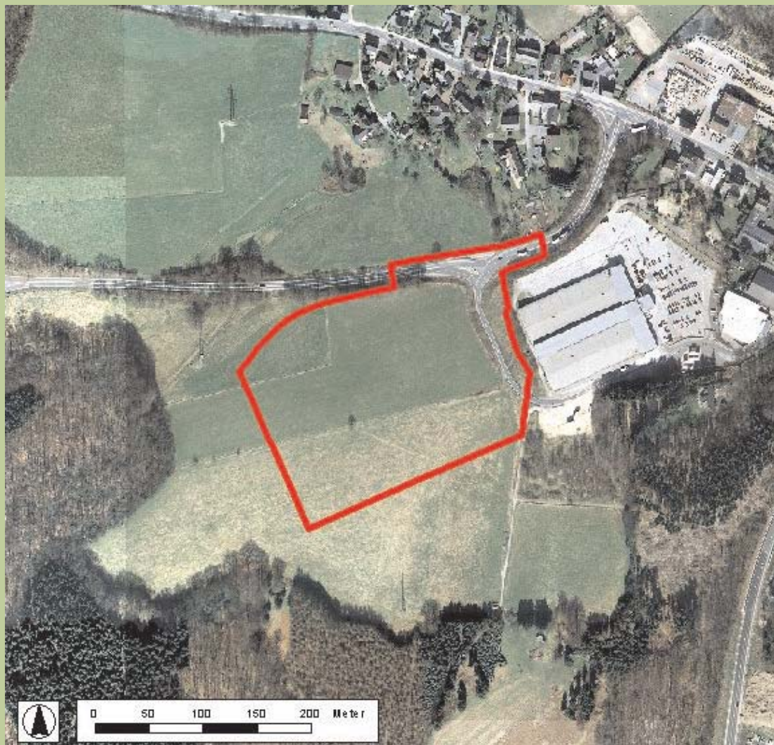
Luftbild © Städtischer Abwasserbetrieb Wermelskirchen (SAW), 2004