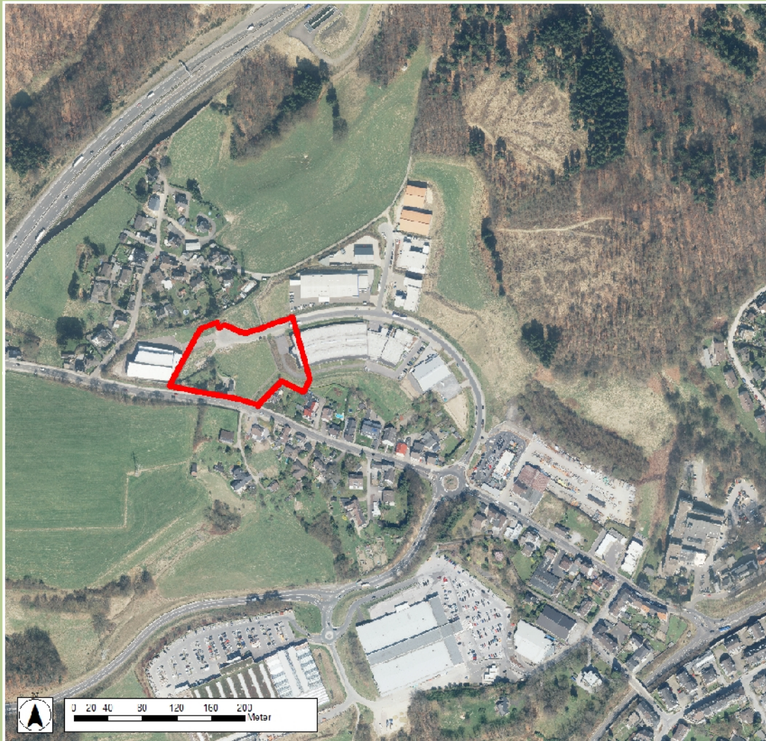
Luftbild 2013, Geobasisdaten der Kommunen und des Landes NRW © Geobasis NRW 2013