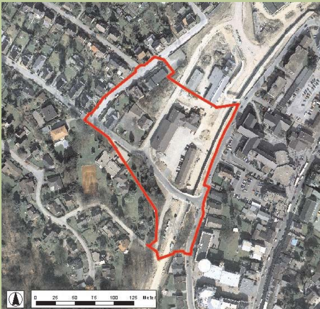
Luftbild © Städtischer Abwasserbetrieb Wermelskirchen (SAW), 2004