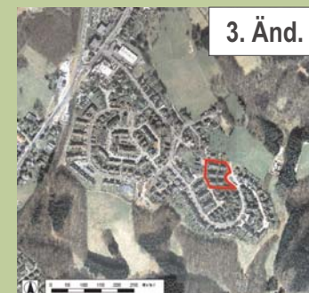
Luftbild © Städtischer Abwasserbetrieb Wermelskirchen (SAW), 2004