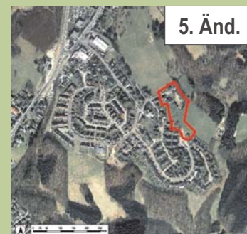
Luftbild © Städtischer Abwasserbetrieb Wermelskirchen (SAW), 2004