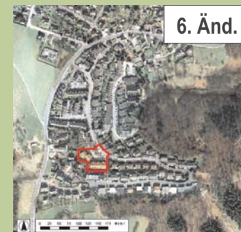
Luftbild © Städtischer Abwasserbetrieb Wermelskirchen (SAW), 2004

Textl. Festsetzungen siehe Planzeichnung